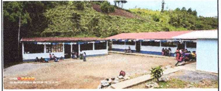
Foto 10: Reparación de techo de los edificio No. 1 y 2. 4 aulas, una dirección y bodega.