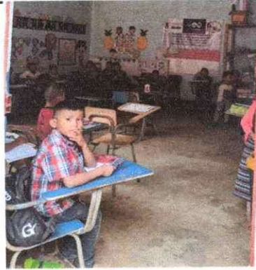
Foto 04: Sustitución de piso rústico a piso cerámico. Aula No. 1.